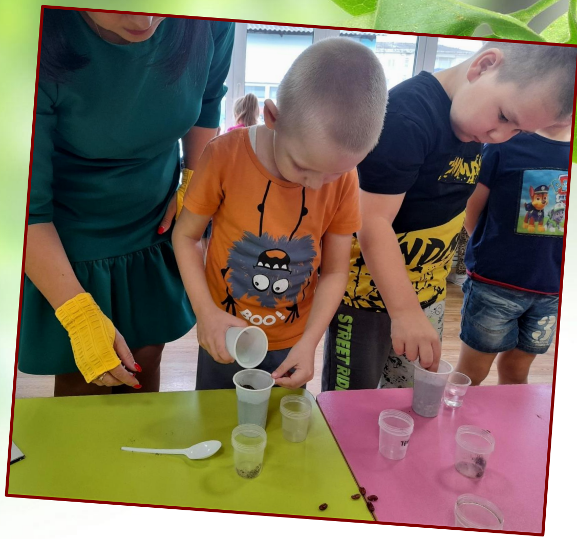
Самостоятельная посадка бобов фасоли.