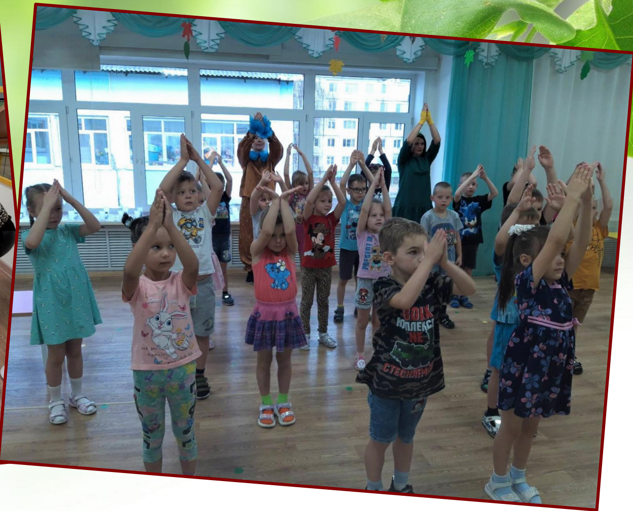
Физкультминутка «Комнатные растения»