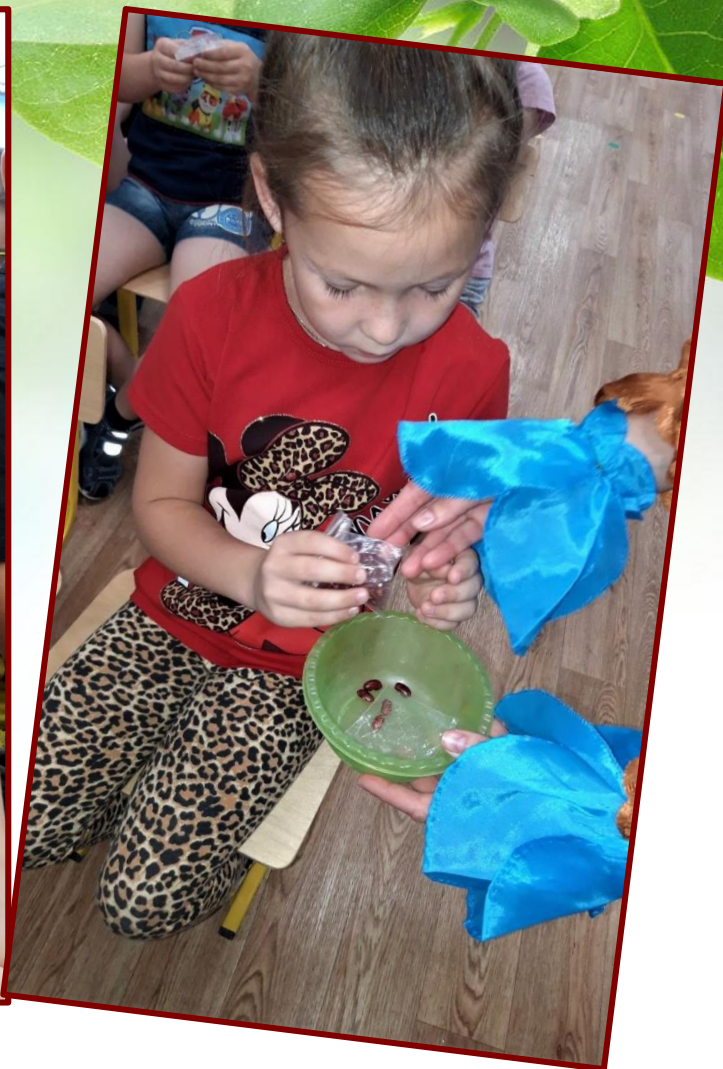
Рассматривание бобов фасоли.