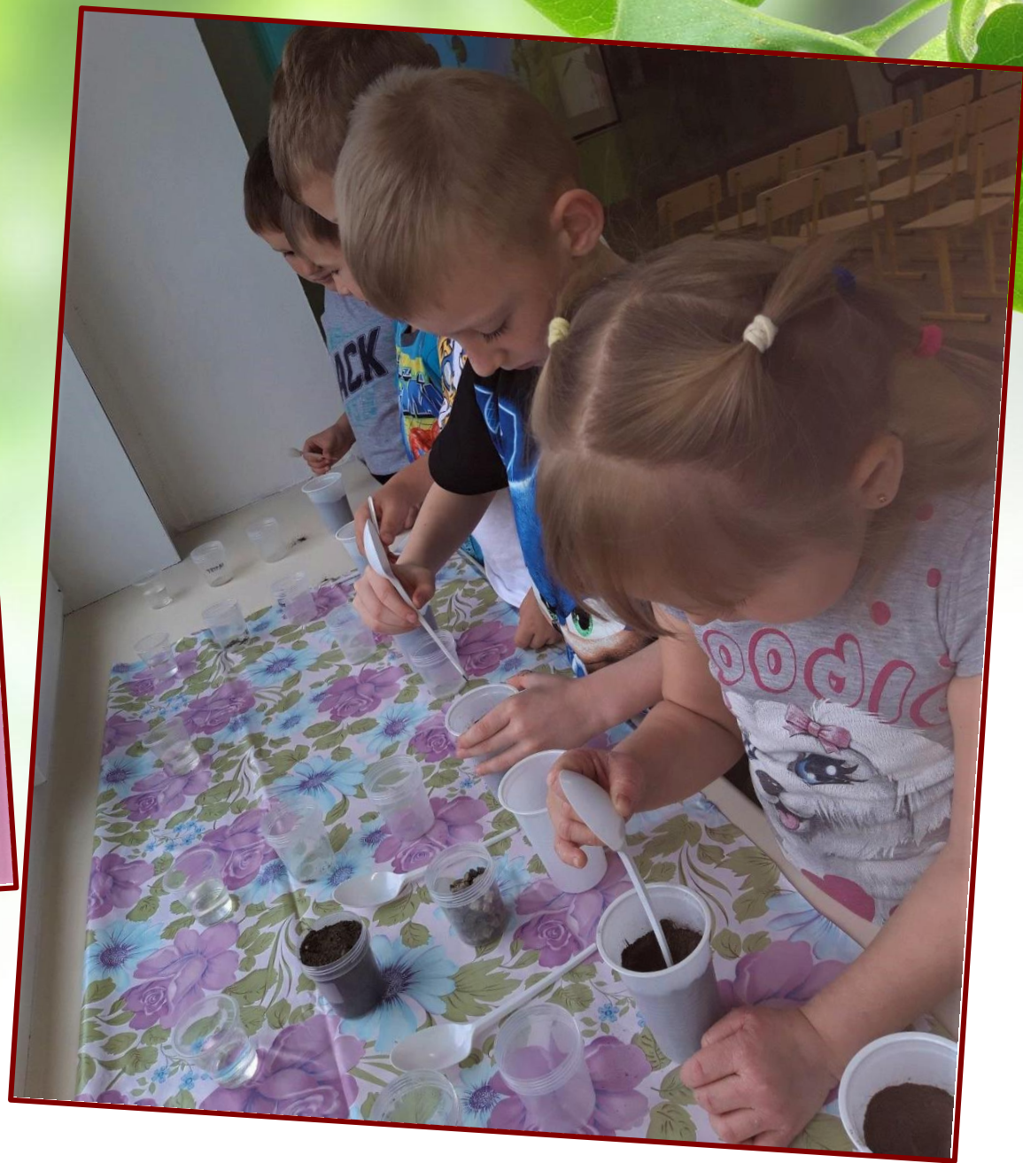
Самостоятельная посадка бобов фасоли.