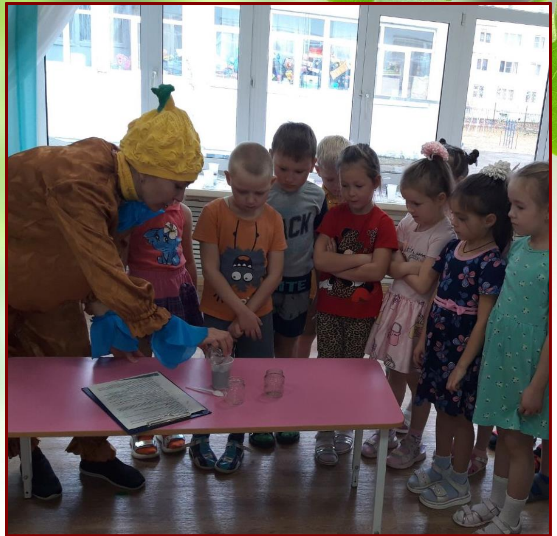
Шалун демонстрирует ребятам порядок действий при самостоятельной посадке бобов фасоли.