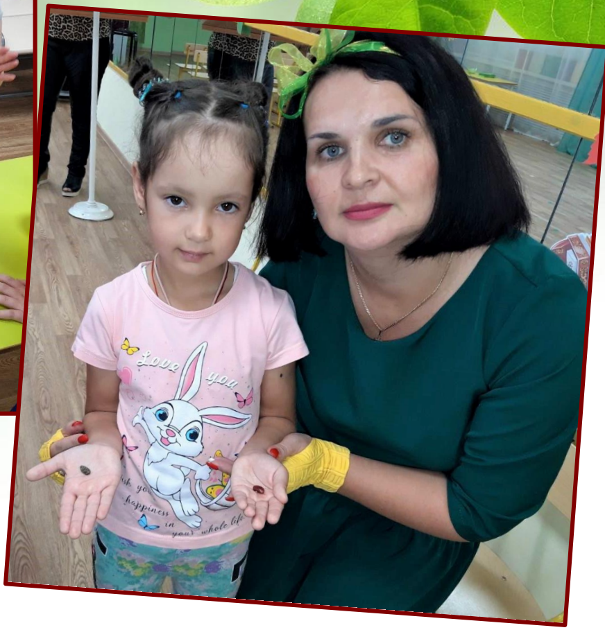
Сортировка семян: арбузных и фасоли.