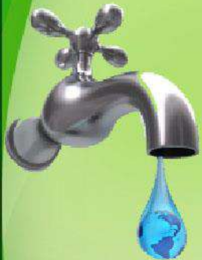
Фото-репортаж: реализация проекта «Энергосбережение – ресурсам уважение!»