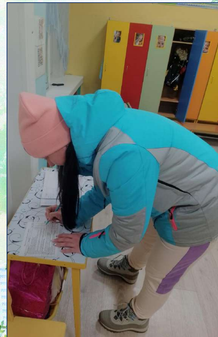
Анкета «Умеете ли вы экономить энергию?»