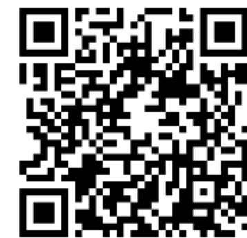
«Над нами не каплет...»

Интересен мультфильм «Над нами не каплет...» 1984 г.