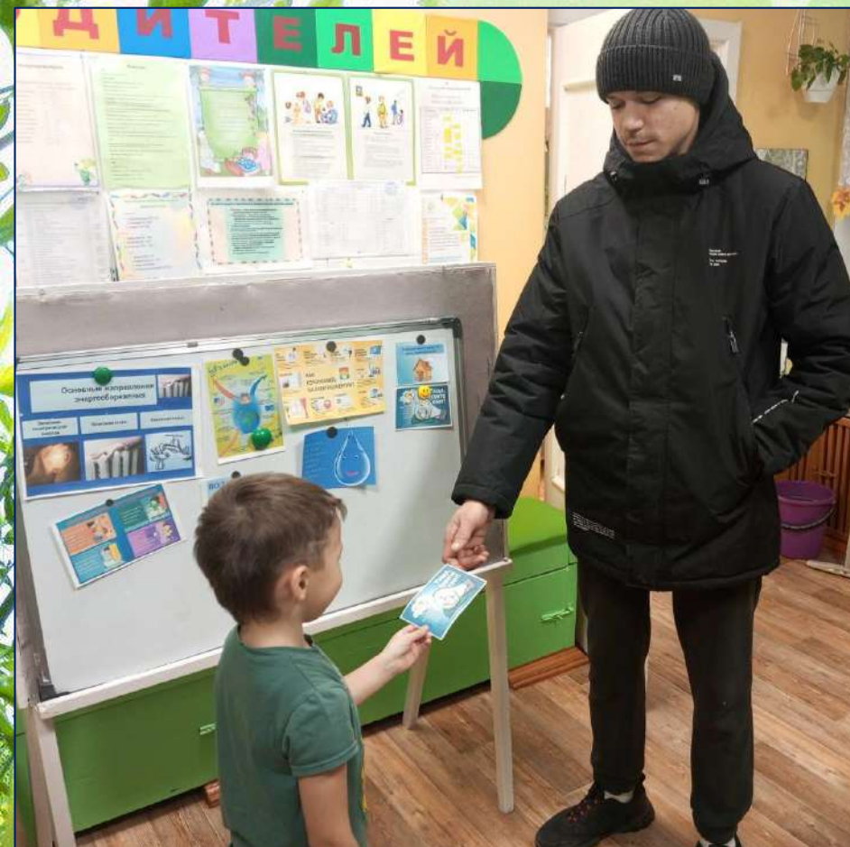
Листовка для папы.