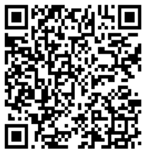
«Уходя, гасите свет»