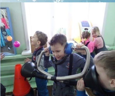
Можно оценить громкость крика