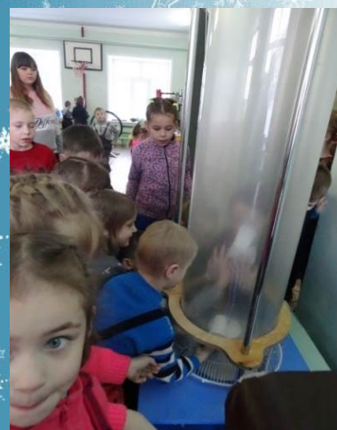
Воздух двигает предметы