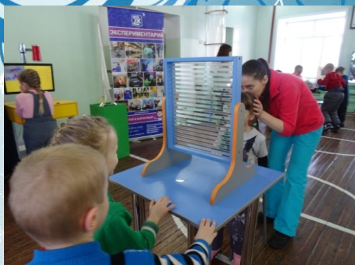
Можно посмотреть в зеркало времени