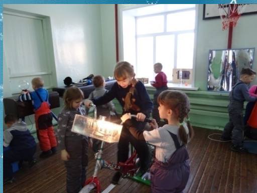
Генератор вырабатывает электроэнергию