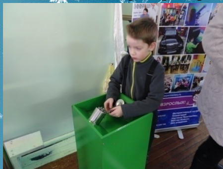
Термометр из монет