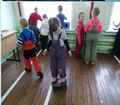
Ощутить свое равновесие-возможно